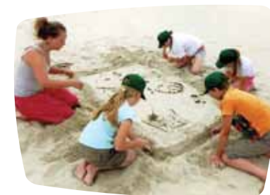
Kretingos Šv. Antano Dienos centro vaikai vasaros stovyklos metu "kepa" smėlio pyragą.

Smagiausias momentas visų metų būna kai vaikai, jaunimas ir šeimos turi progą pailsėti, pasidžiaugti gamta, ir pabendrauti vasaros stovyklose. Šalpa supranta, kad tai yra labai reikalinga ir naudinga, todėl jau nuo pat nepriklausomybės