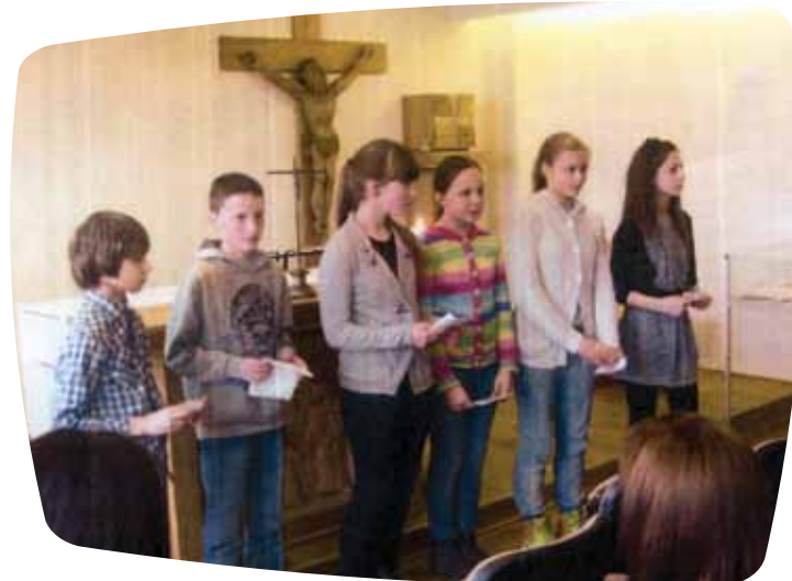
J. Urbšio mokyklos koplyčioje mokiniai pasakoja apie Rūpintojėlio istoriją

Gan dažnai gaunami prašymai idant Šalpa padėtų įsigyti kokį nors reikalingą naują inventorių arba pakeisti sudėvėtus, pasenusius daiktus į naujoviškesnius. Po dvidešimts metų nepriklausomybės jau daugeliui Šalpa padėjo tai padaryti, tačiau tokie prašymai dar nesibaigia.