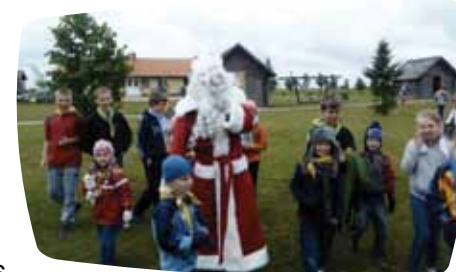
Į "Spiečiaus" stovyklą atvyko net ir Kalėdų Senelis

bendruomenėje, kaip atsakomybę ir įsipareigojimą, ugdyti dorovines vertybes, remiantis krikščioniškomis nuostatomis. Stovykla šauniai praėjo ir stovyklos uždaryme visi dalyviai vienbalsiai kartojo, jog nenori palikti sodybos!