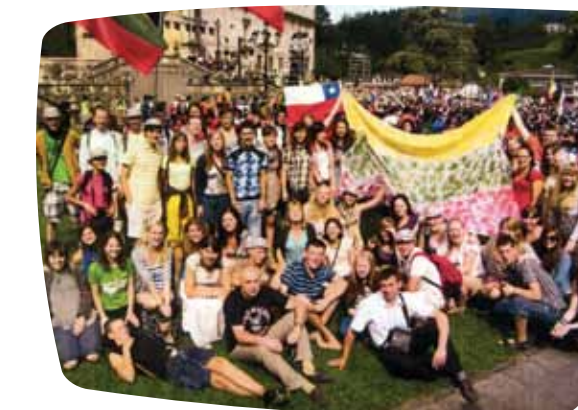
Kauno arkivysk. Kauno I dekanato dalyviai Pasaulio Jaunimo Dienose.