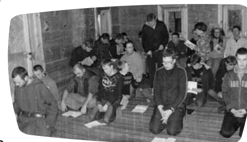
Babtų jaunimo centro surengto vaikų savaitgalio akimirka

Babtų Šv. apaštalu Petro ir Pauliaus parapijos savaitinis vaiku ir jaunimo centras "Jėzui linksmai", prašė finansinės paramos centro veiklai kuri yra labai įvairi. Kiekvieną sekmadienį vaikai ir jaunimas dalyvauja Šv. Mišiose, vadovauja giedojimui evangelizacinėse ir piligriminėse kelionėse, dalyvauja/gieda vasaros stovyklose ir reguliariai dalyvauja savaitinėse repeticijose, tris dienas per savaitę. Čia pirmas kartas, kad Babtų parapijos kokia nors organizacija kreiptųsi paramos į Šalpa. Prašymas buvo patenkintas.