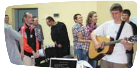
Giedam Viešpačiui naują giesmę Lukiškių kalėjime

Lietuvos Caritas atsiuntė finansinės paramos prašymą jų vykdomam projektui "Kalinių globa ir reintegracija". Valdžia kuria įvairias nuteistųjų integracijos programas, bet deja nuteistieji arba buvę kaliniai greitai prisitaiko prie naujų sąlygų ir vėl eina įprastais keliais. Niekas per daug apie tai nesirūpina. Tačiau atsirado geros valios žmonių, kurie matė reikalą padėti nuteistiems atsigauti dvasiškai. Lietuvos Caritas bendrauja su jais, sutelkdamas gausų būrį savanorių iš įvairių socialinių sluoksnių ir suranda taip reikalingą finansavimą. Buvo pasirinkta dvasinė programa (Alfa kursai) ir vedama nuteistiesiems iki gyvos galvos.