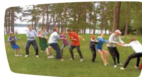
Žaidimas, kuris teikėsi nuspręsti "Kas stipresnis"

Vilniaus pal. Jurgio Matulaičio parapijos vaikų ir paauglių vasaros stovykloje dalyvavo 50 jaunimo nuo 9-15 m. ir 12 vadovų. Organizatoriai atsilepdami į Lietuvos vyskupų kvietimą 2011 metus skirti Dievo gailėstingumui, stovyklą pavadino "Būk gailėstingas". Aiškiai pagal šį šūkį stovykloje sukosi jos veikla.