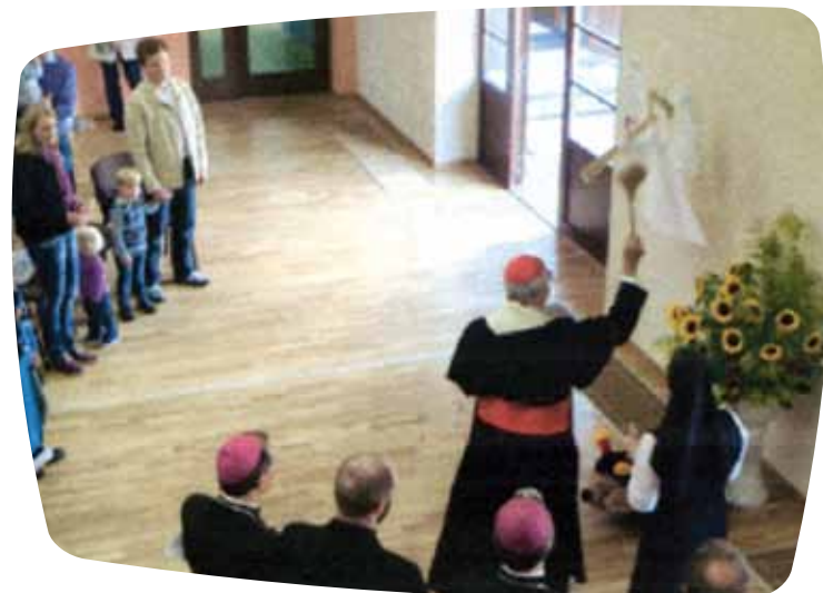
Kardinolas A. Bačkis šventina Naujas “Mažutėliai” darželio patalpas.

Naujai steigiamam katalikiškam vaikų darželiui “Mažutėliai” Vilniuje, seselėms kurios ten dirbs prašant, buvo paskirta parama dalinei technikai, aplinkos priežiūros reikmenims ir administraciniams reikalams įsigyti. Didelis džiaugsmas turint naują katalikišką darželį.