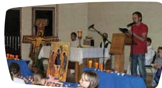
Šv. Mišių auka Kybartų stovykloje.

supažindinti vaikus ir jaunimą su lietuviškomis šventėmis bei jų pagrindiniais akcentais, ugdyti naujus vadovus, mažinti atotrūkį tarp įvairių kartų ir socialinės atskirties grupių, stiprinti bendruomeninius ryšius, skatinti savanorystę