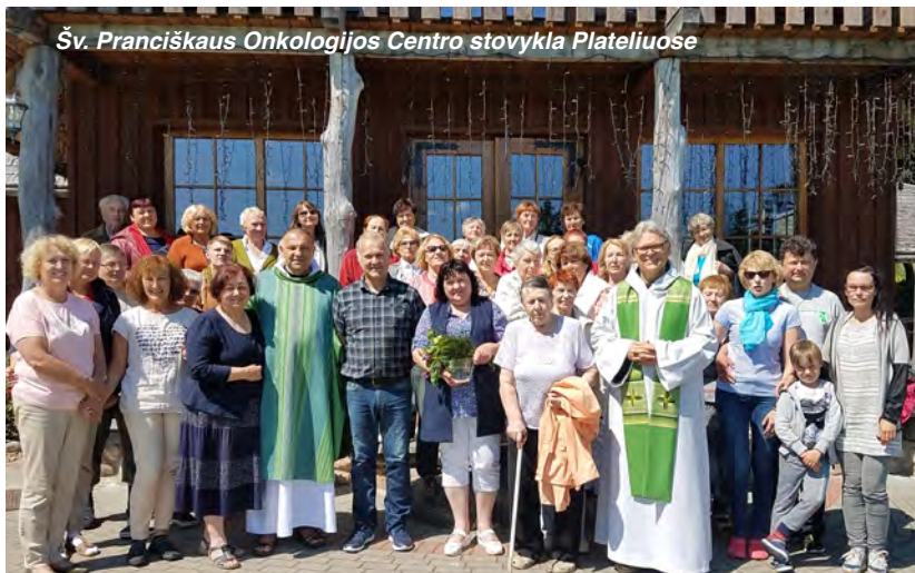
Šv. Pranciškaus Onkologijos Centro stovykla Plateliuose

Per 2017 m. LKR Šalpa paskyrė $87,650 dolerių 38 gautiems prašymams atnaujinti pasenusį ar įsigyti naują inventorių. Utenos Šv. Klaros palaikomojo gydymo ir slaugos ligoninė įsigijo pramoninę skalbimo mašiną už LKRŠ skirta $3,000 dolerių paramą. Telšių vyskupijos Vydmantų Šv. Jono Krikštytojo parapijai, kuri toliau kuriasi, LKRŠ skyrė $8,500 dolerių paramą liturgijos šventimui daiktams įsigyti. Lietuvos Vyskupų Konferencijos įvairiems projektams paremti, paskirta $55,000 dolerių parama.